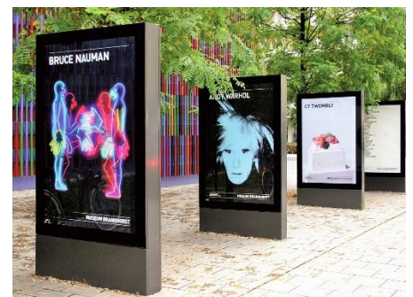
City-Lights sind urban, elegant hinterleuchtet und werten den Innenstadtbereich auf. Sie sind perfekt für Werbung.

Gute Lösungen sind einfach aus einer Hand. Mit einem viertel Jahrhundert Erfahrung in Planung, Montage und Service sind wir der umfassende Partner für ihre Projekte.