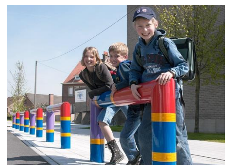
Serie „Julie“ ist innovativer Schutz durch Schul-Branding